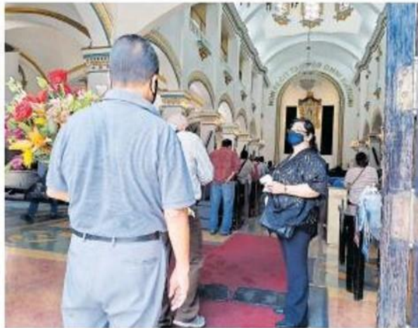
Los centros de culto se reincorporaron por el segundo cierre en diciembre