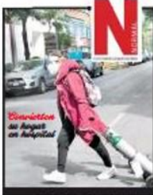
CONTRATOS DE ANTES EN HOSPITAL

NORMAL Hospitales en casa Con los centros de salud casi llenos en todo el país, mexicanos que se contagian piden quedarse en casa y ver si pueden vencer el virus. Surgen nuevos servicios.